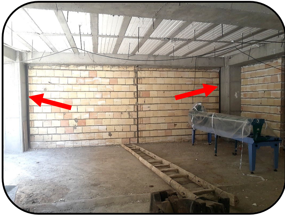
شکل ۲) اجرای وادار در بر ستون