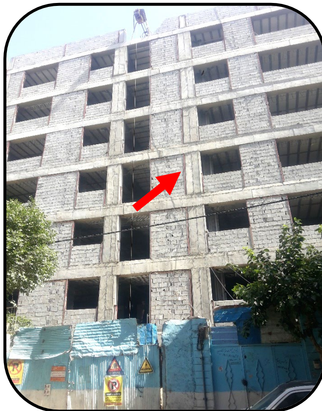
شکل ۳) اجرای وادار در بر ستون های نما