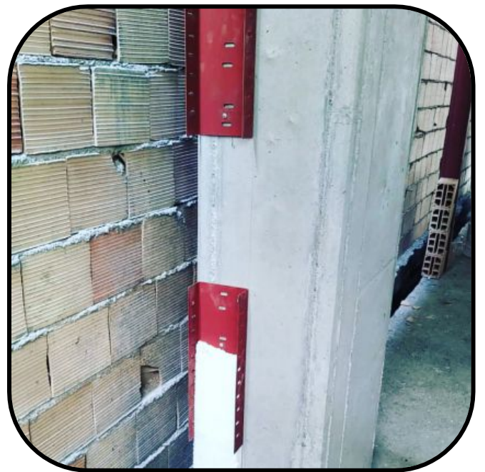
شکل ۴) اتصال صحیح دیوار به ستون با ناودانی و یونولیت